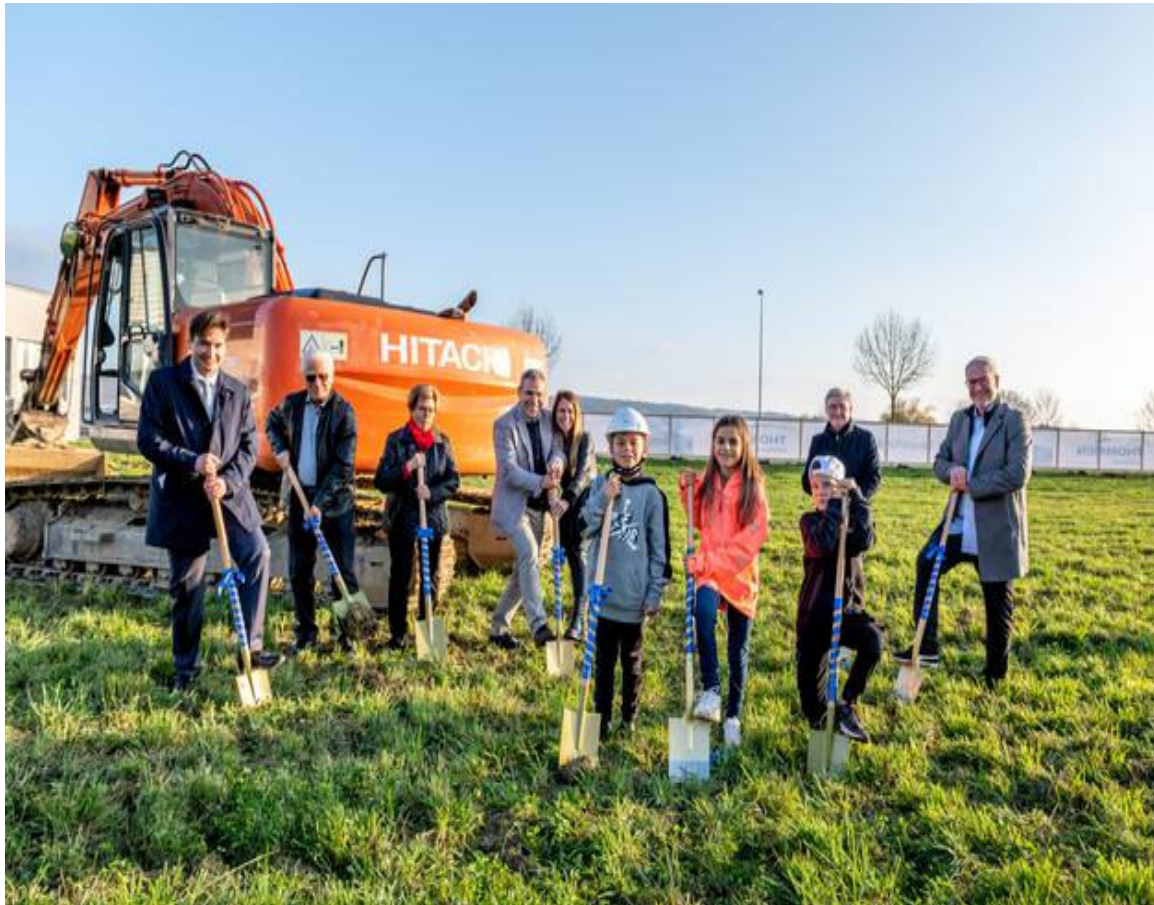
Spatenstich zum Neubau von Thommen Medical, Grenchen